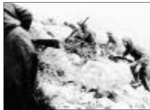
A sinistra, soldati del 22esimo fanteria Cremona. Sopra, militari italiani all'attacco di Monte Lungo nel dicembre '43

mento fondamentale di quell'evento che si chiamò Resistenza. In altre parole, di questo evento che, al di là di schematizzazioni e interdizioni storiche durate troppo a lungo, ha significato la rinascita dell'Italia e l'alba della nostra democrazia, furono a parimerito protagonisti anche i no-