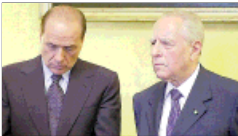
Berlusconi e Ciampi

Per queste ragioni Ciampi è dovuto intervenire immediatamente: perché stanno saltando le regole del sistema, dopo che ambiguamente s'è cercato d'intimidire l'arbitro. Ma se così è, con Ciampi sono chiamati inevitabilmente in causa gli altri vertici dello Stato, che troppo spesso trovano facile riparo nel modernissimo "terzismo" e nelle sue ambiguità di comodo. Le autorità imparziali non devono schierarsi, mai. Ma se in causa è la qualità della democrazia, non possono sottrarsi. Salvo tradire il loro alto ruolo.