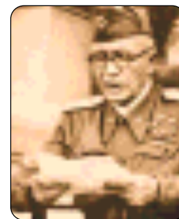
Badoglio legge l'armistizio DA PAGINA 41 A PAGINA 44

Quell'otto settembre nella nostra storia