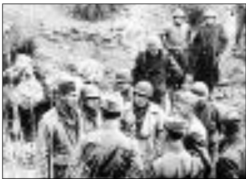
Il generale Clark a colloquio con il generale Dapino, del I raggruppamento motorizzato

Lo sbarco in Calabria degli Alleati avvenne, dopo un furioso bombardamento aereo e navale, in una striscia di spiagge prospicienti Punta Faro. Era il 3 settembre, cinquantatré giorni dopo lo sbarco sulle coste meridionali della Sicilia. Le due azioni, militarmente simili, furono politicamente diverse. In Sicilia i nemici, oltre i tedeschi, eravamo noi italiani. In Calabria, nelle stesse ore in cui i soldati dell'VIII armata britannica e della V armata americana, toccavano il "continente", il generale Castellano firmava a Cassibile l'armistizio: gli italiani erano vinti ma dal 3 settembre cominciarono a non essere nemici. Cinque giorni dopo, con l'annuncio ufficiale all'Eiar di via Asiago da parte del maresciallo Badoglio, dell'avvenuto armistizio, gli italiani cominciarono a diventare amici. E in quel mese di meraviglie che fu il settembre 1943, mentre in una parte della Puglia riprendeva forma e legittimità internazionale lo Stato